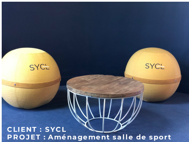
CLIENT : SYCL PROJET : Aménagement salle de sport